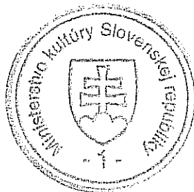
František Tóth minister kultúry

Toto rozhodnutie nadobúda účinnosť 15. januára 2006.